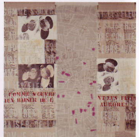
Achterkant 'Lunaria annua' (2006), zijde, katoen, foto transfers, 100 x 100 x 5 cm.