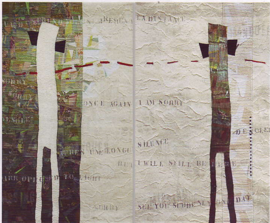
'The silence in between' (2009), katoen, zijde, zijden velour, 126 x 165 cm.